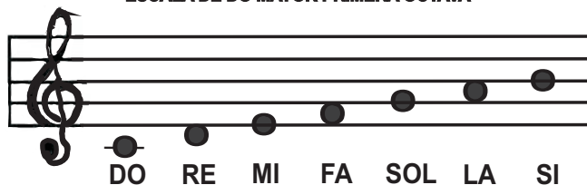
ESCALA DE DO MAYOR PRIMERA OCTAVA

(se representan con letras en mayusculas)